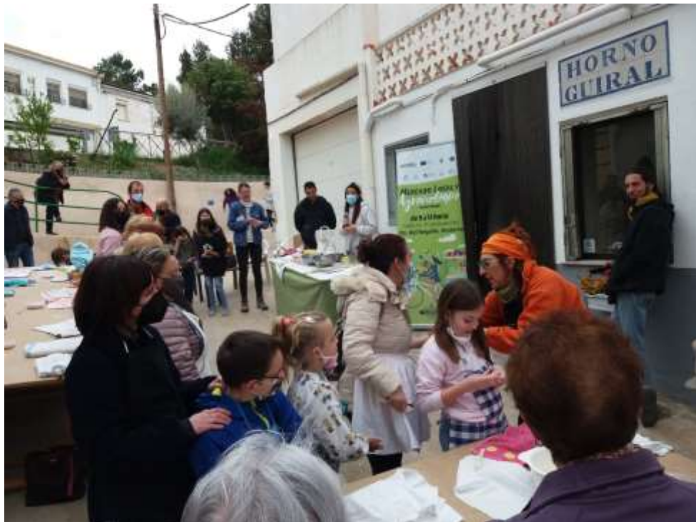
Agroexperiencia con Horno Guiral, en Urrea de Gaén.