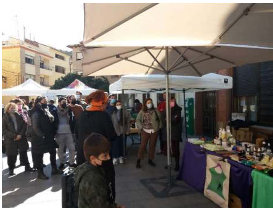
Dinamización del Agromercado en Andorra.