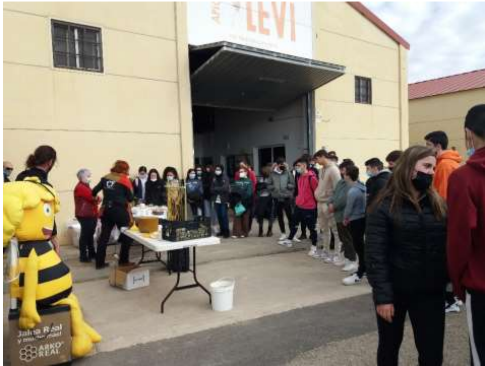
Apícola LEVI, Ariño.