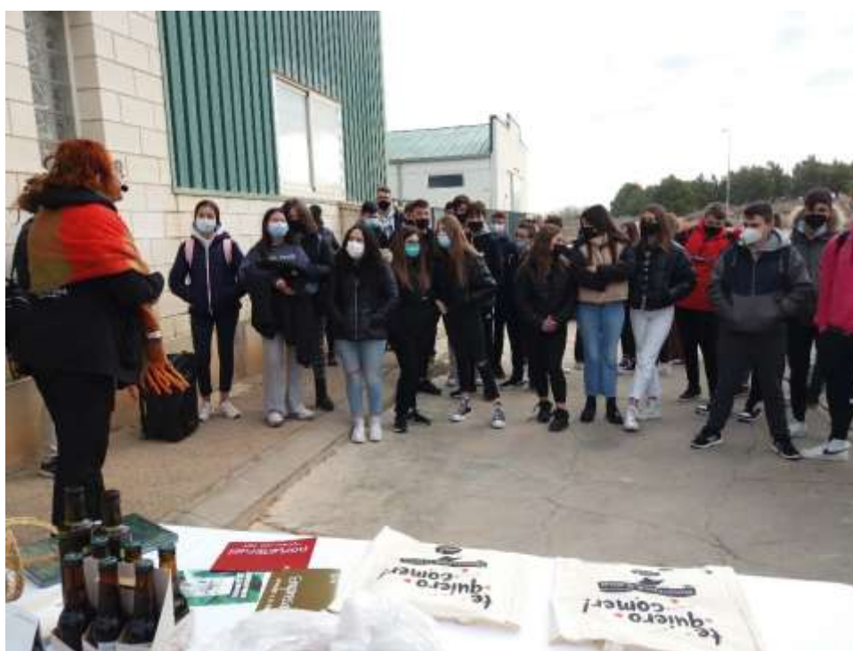
Aceites Impelte, La Puebla de Híjar