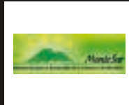
ASOCIACIÓN PARA EL DESARROLLO DE LA COMARCA DE ALMADÉN (MONTESUR)