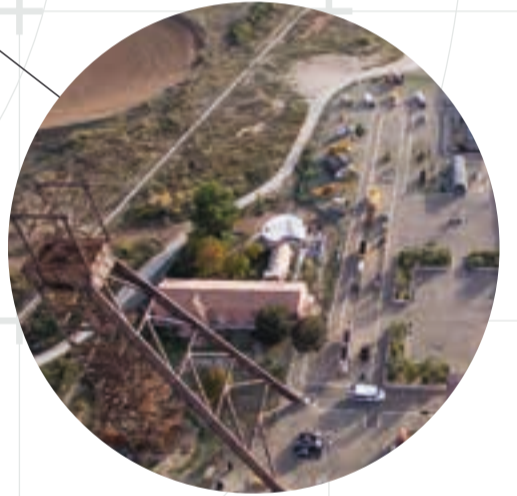
MUSEO MINERO MWINAS