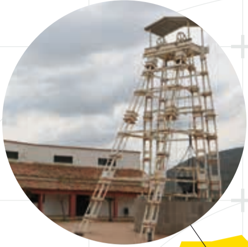
MUSEO MINERO DE ARIÑO