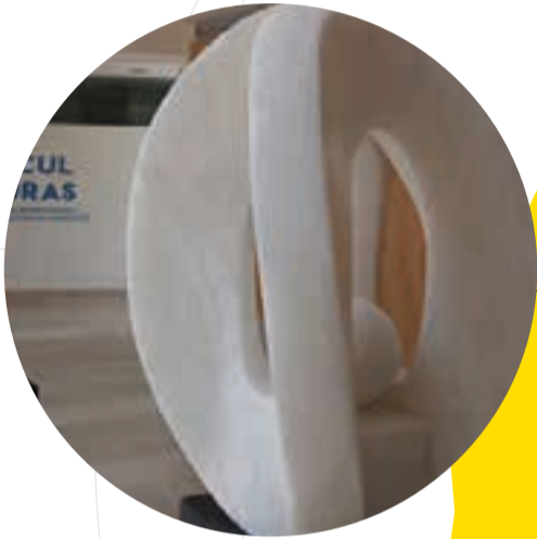
CENTRO INTEGRAL PARA EL DESARROLLO DEL ALABASTRO