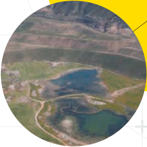
HUMEDAL CORTA ALLOZA