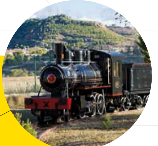
TREN MINERO "POZO SAN JUAN"